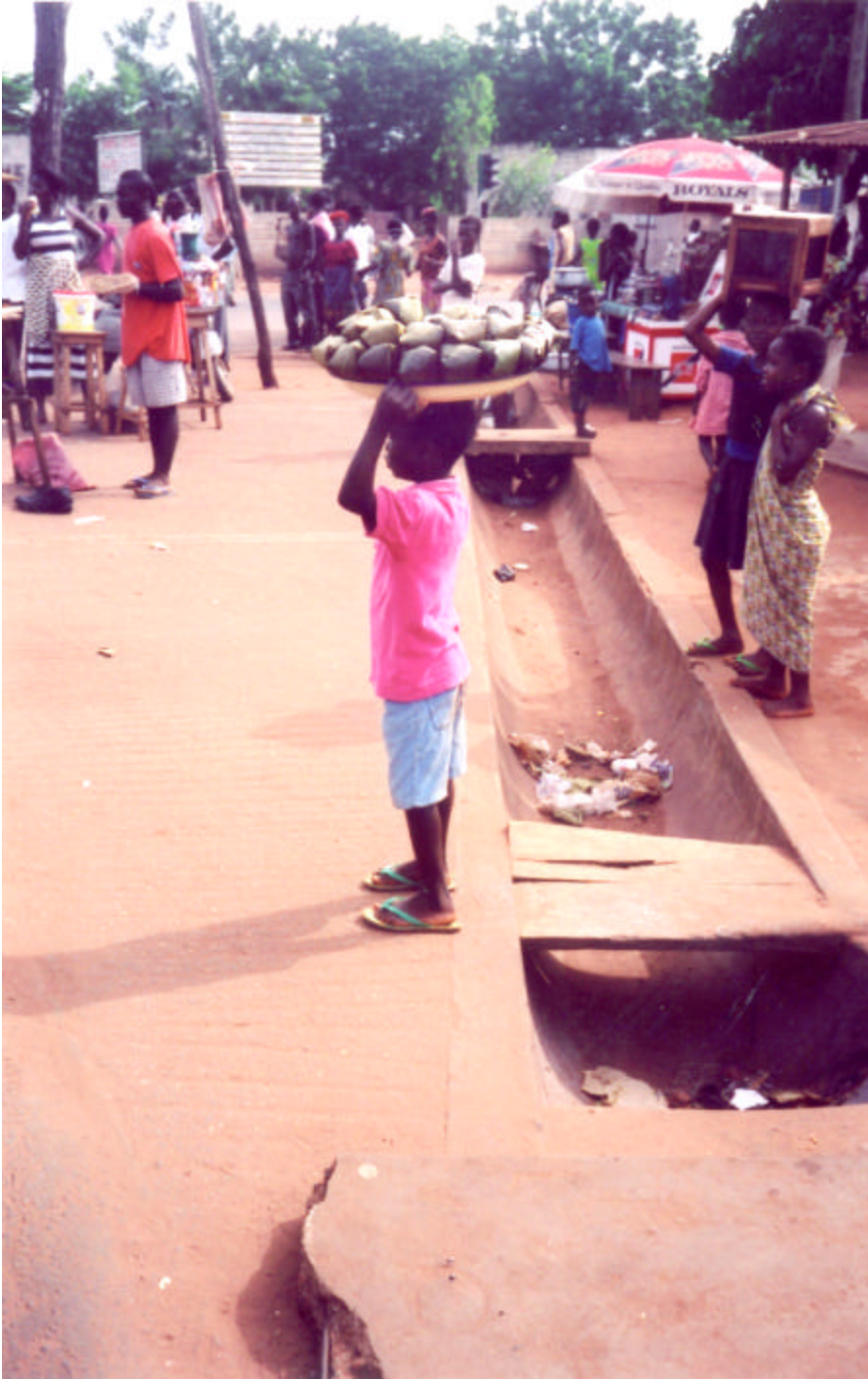
Jeune garçon travaillant sur un marché au Togo. De nombreux enfants victimes de la traite sont contraints à travailler dans des restaurants, sur des marchés et chez des particuliers.