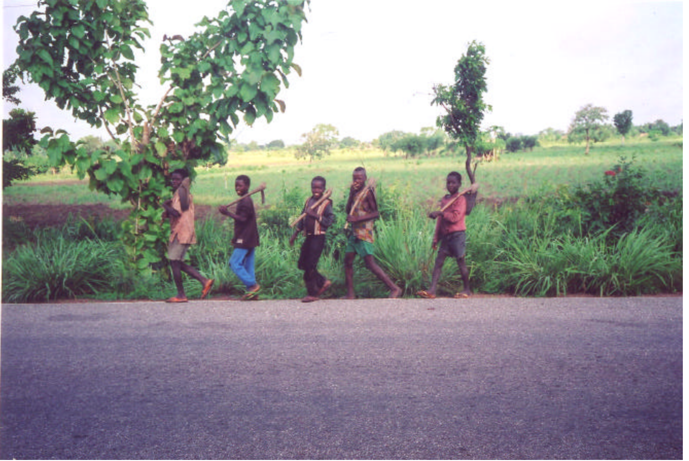
Groupe de jeunes garçons togolais transportant leurs outils au travail. Les enfants victimes de la traite sont souvent contraints à utiliser un équipement dangereux comme des scies et des machettes.