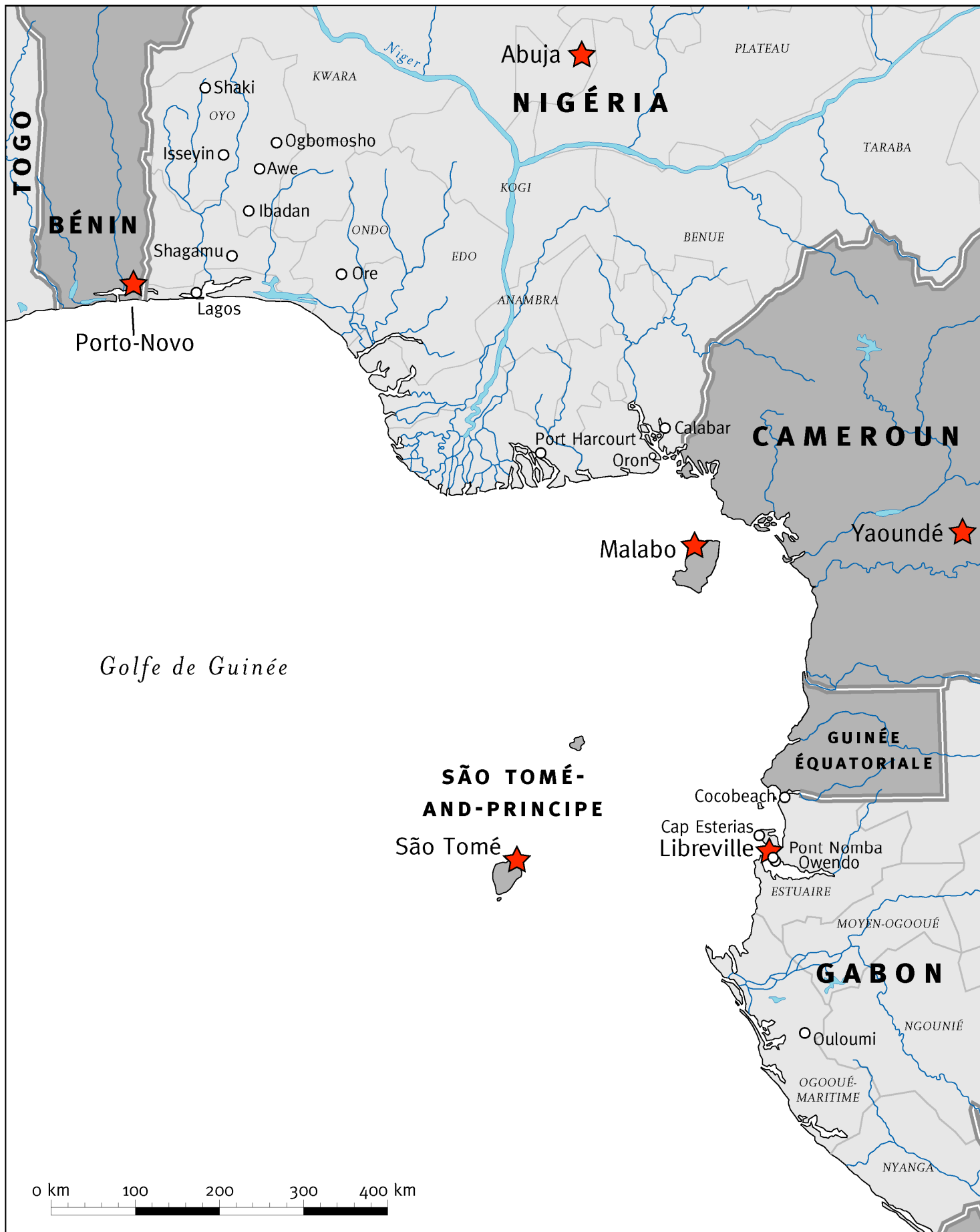
Villes et villages cités dans le rapport