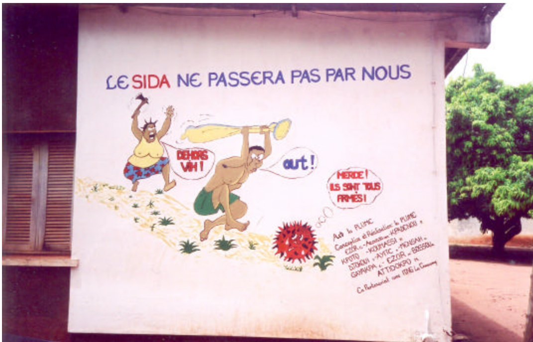
Peinture murale de sensibilisation au SIDA réalisée en partenariat avec une ONG locale. Les enfants victimes de la traite qui accomplissent des travaux dangereux courent le risque d'être infectés par le VIH.