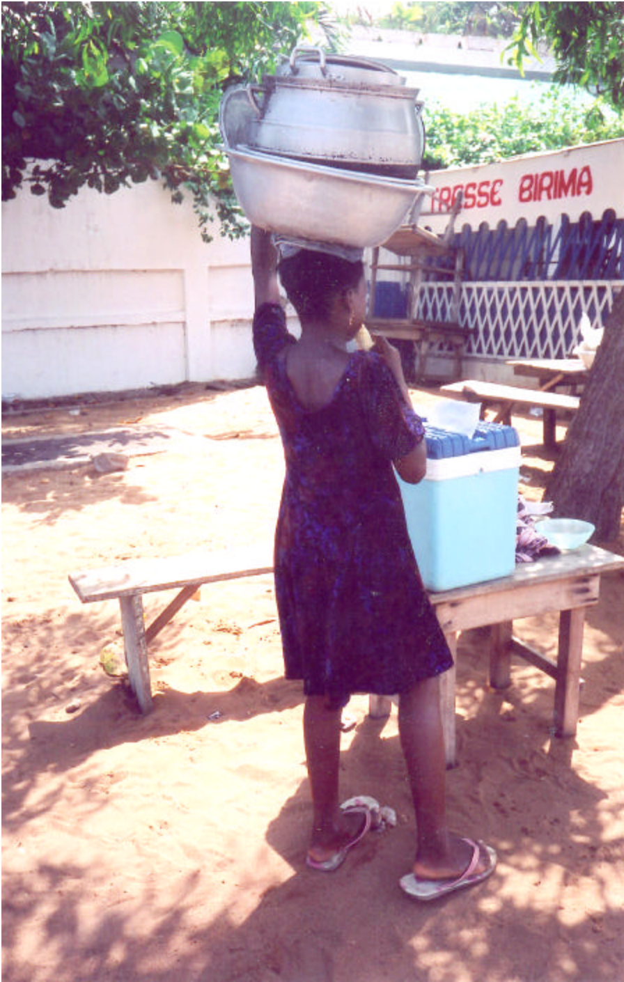
Trop d'enfants parmi ceux qui travaillent aux marchés de l'Afrique de l'Ouest ont été victimes de la traite des enfants.