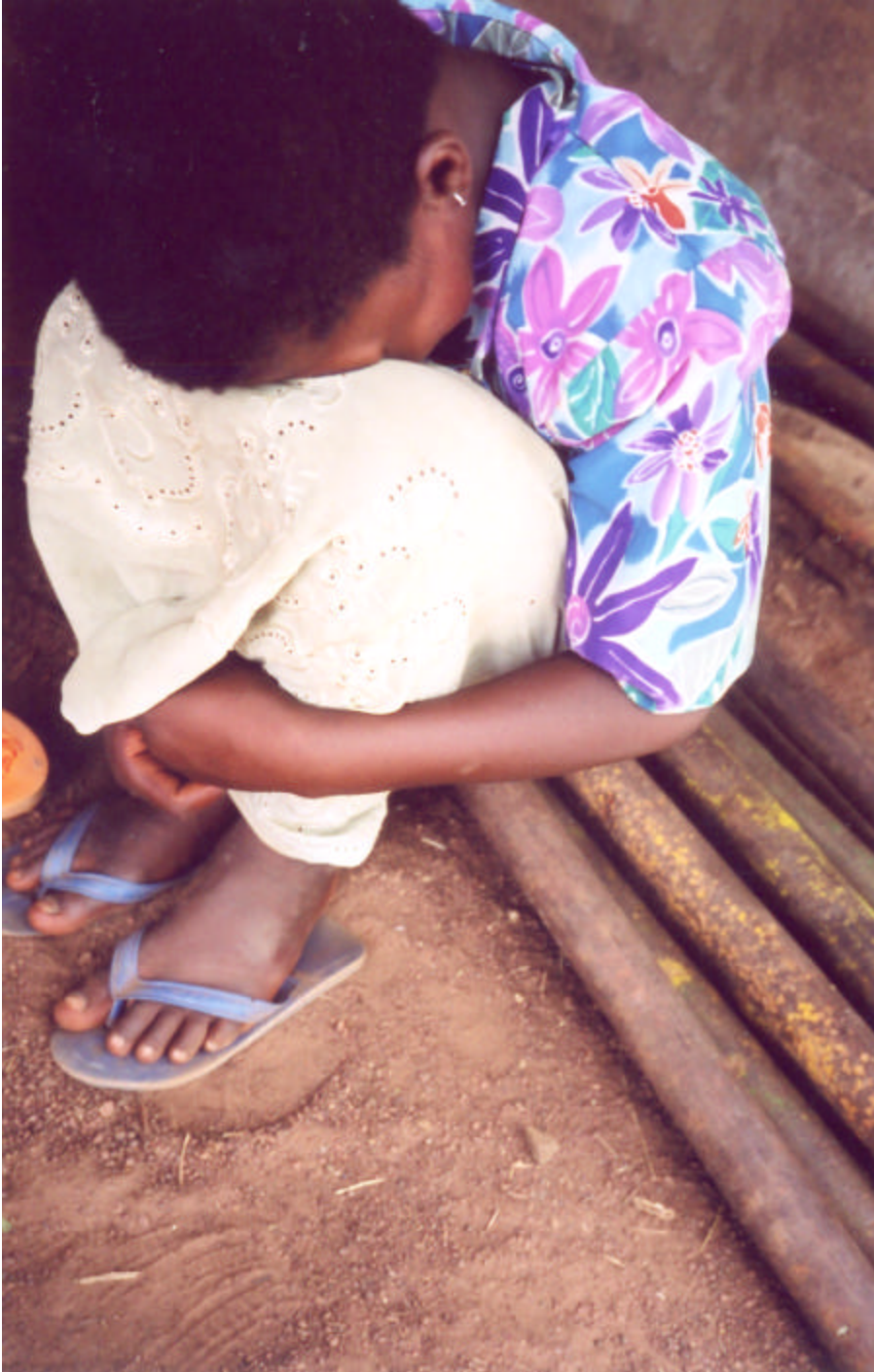
Une fille au Togo qui avait été trafiquée.