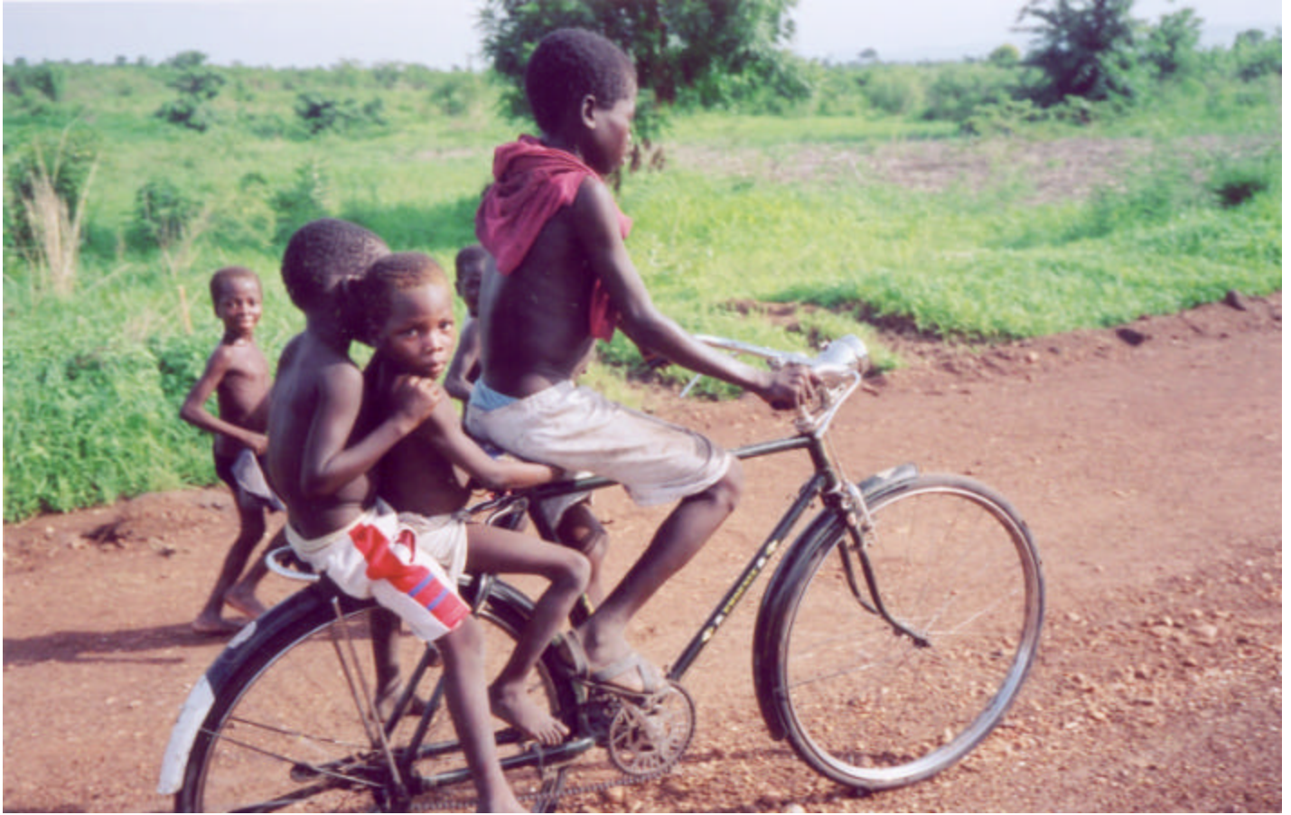
Des enfants au vélo au Togo. Des vélos neufs sont parmi les promesses faites par les trafiquants pour tenter les enfants à travailler à l'étranger.