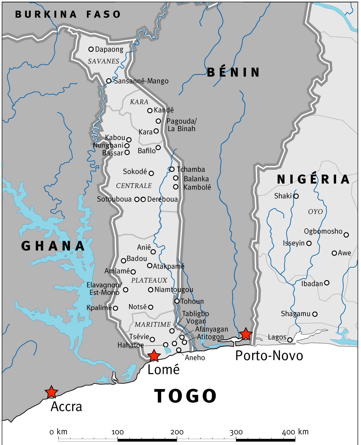
Villes et villages cités dans le rapport